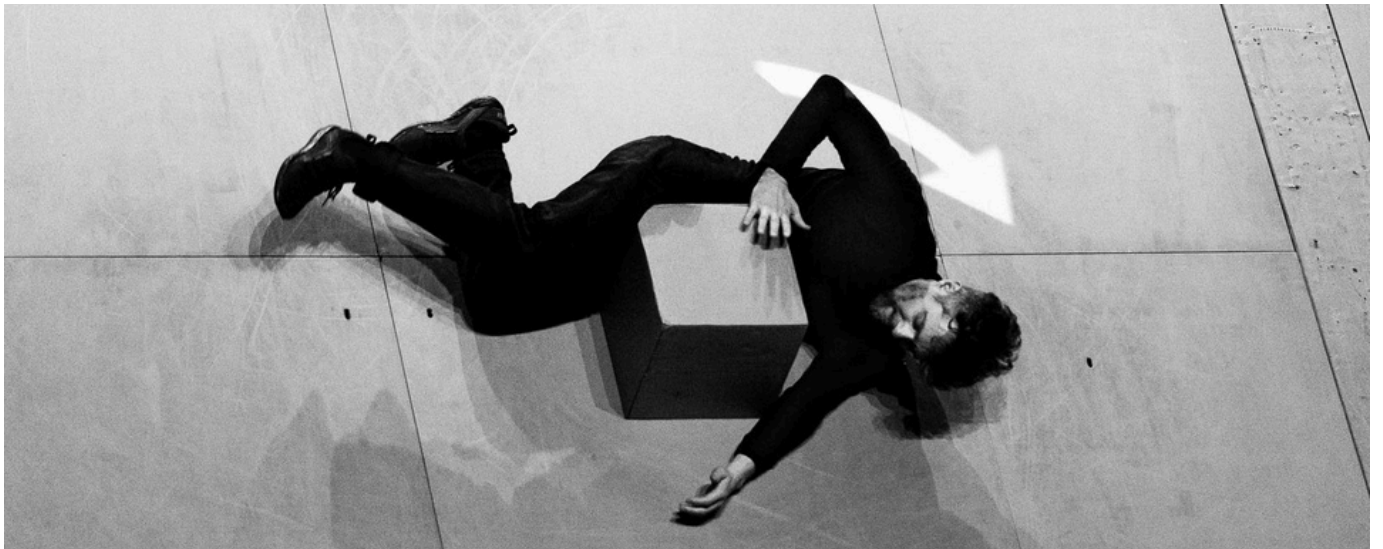
BURNING